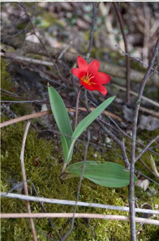
Text und Bilder Manfred Bröker